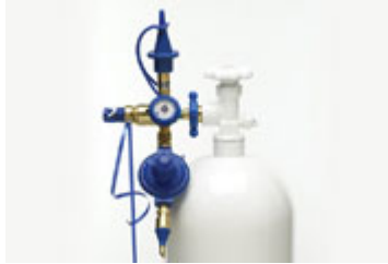
Precision Plus Inflator $1,575.50

Puedes encontrar válvulas especiales para inflado de globos de Microfoil, equipos para inflado automático, en fin una gran variedad de equipo que es muy redituable.