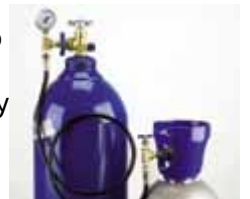
Mini Cart Combo $5,485.50 Transfill (válvula trasvasadora) $2,202.25

En caso de requerir tanques de menor capacidad te recomendamos este combo que incluye el tanque, un carrito transportador, válvula para látex, extensión de 3 metros y válvula para globos foil y su complemento el transfill para que puedas recargarlo desde un tanque con mayor presión