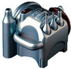
Mini Cool Aire Inflator $1,495.00

Aire Debido a su potencia y portabilidad los infladores eléctricos de aire son la forma ideal para inflar grandes cantidades de globos de látex. Existen infladores con una o cuatro salidas, infladores manuales de diferentes modelos y precios.