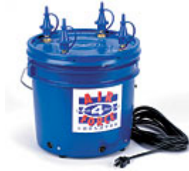
Air-Force 4 $4,008.90

Mini Cool Aire Inflator Kit Incluye inflador, estuche y pedal Normal $2,868.00 Ahora $2,699.00