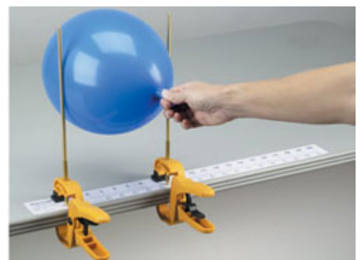
Grip guide Balloon Template $847.55